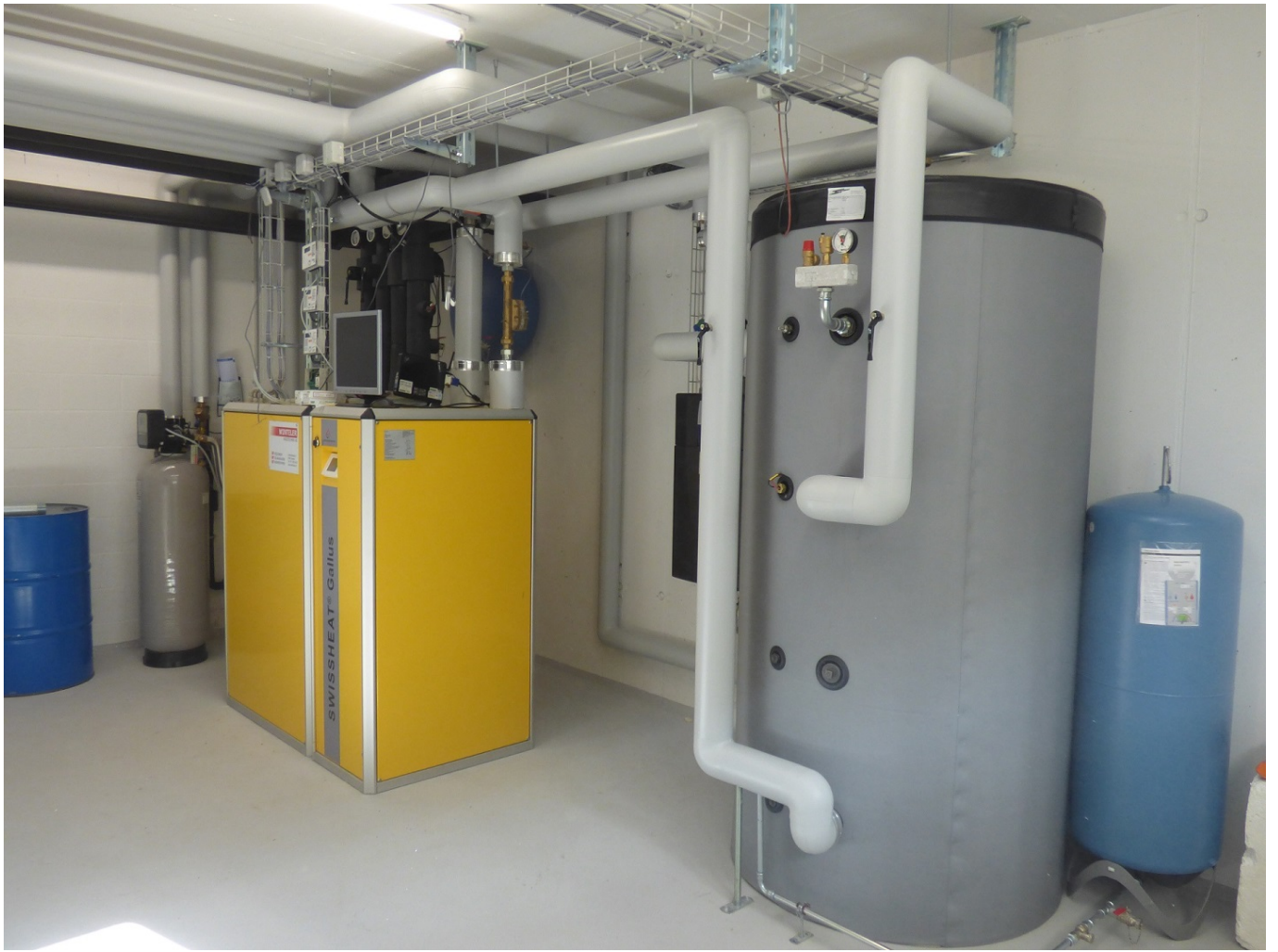
Bild 3 (Grafik, Funktions-Skizze als Ergänzung): Funktions-Schema zur Energie-Komplettlösung „Heizen mit Solar“